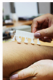
ภาพทดสอบภูมิแพ้