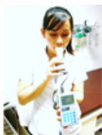
การตรวจสมรรถภาพปอด